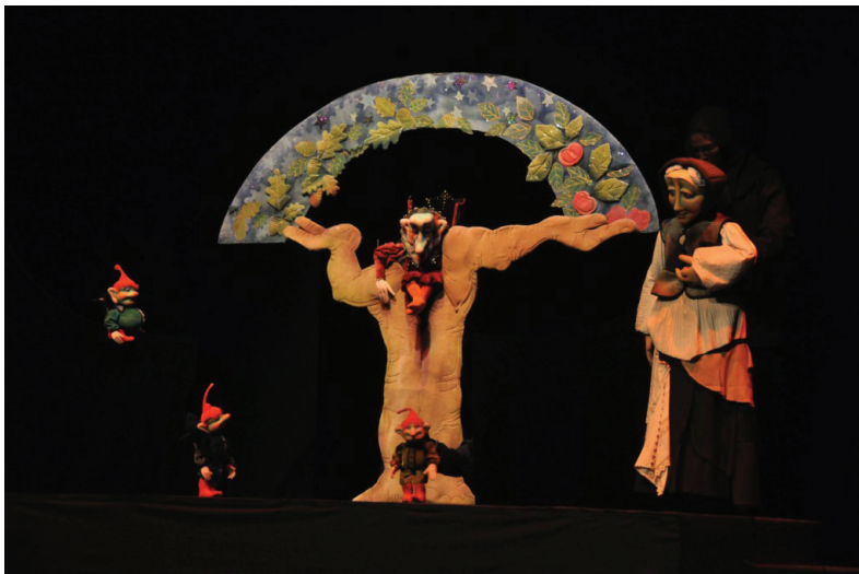
“Šuma Striborova”, Scena Martin; Redatelj Himzo Nuhanović