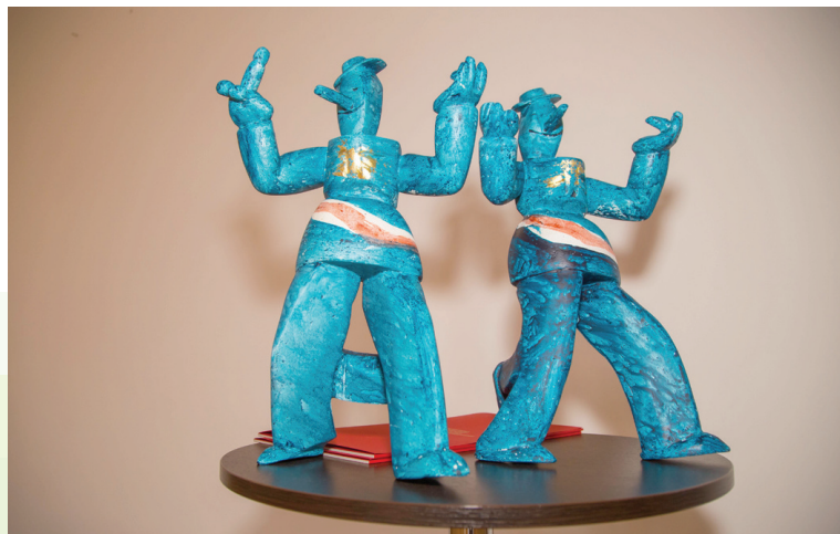
Statua "Šokac" rad akademika Zlatka Boureka

Uvodni tekst koji je napisao naš Zvonko Festini 2015. godine u povodu 20. lutkarskog proljeća.