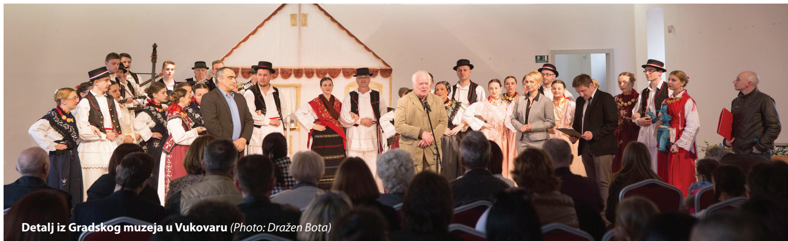
Detalj iz Gradskog muzeja u Vukovaru

Ova radionica se provodi u suradnji s Agencijom za odgoj i obrazovanje i dio je stručnog usavršavanja polaznika.